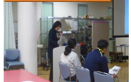
第 2 アルファ歯科