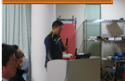
リハビリ型デイサービス喝采

10 種類のアイテムを組み合わせてリハビリ実施。男性の利用者が多く落ち着いた雰囲気ようです。