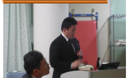
リハビリ型デイサービス絆

マシンを用いたパワーリハビリを実施。6 月には笠岡甲弩に新規オープン予定。ぜひご利用ください。