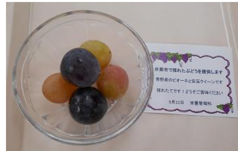
ぶどうの都道府県別収穫量

栄養管理科では、地産地消メニューとして、9月11日に井原市青野産のぶどうを提供しました。採れたてのピオーネと安芸クイーンです。