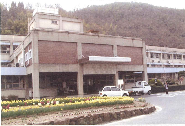
花壇と玄関（平成 14 年頃）