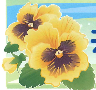
井原市の花 パンジー