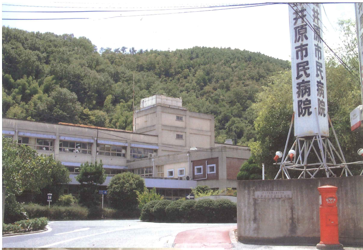
旧病院施設 (昭和38年5月4日～平成13年3月)