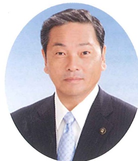
井原市長 瀧本豊文

本日、井原市立井原市民病院創立50周年記念の会を開催するにあたり、一言ごあいさつ申し上げます。