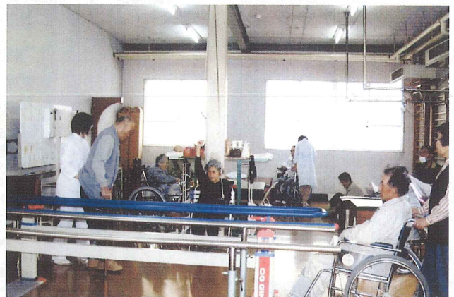
リハビリテーション科（平成 13 年頃）