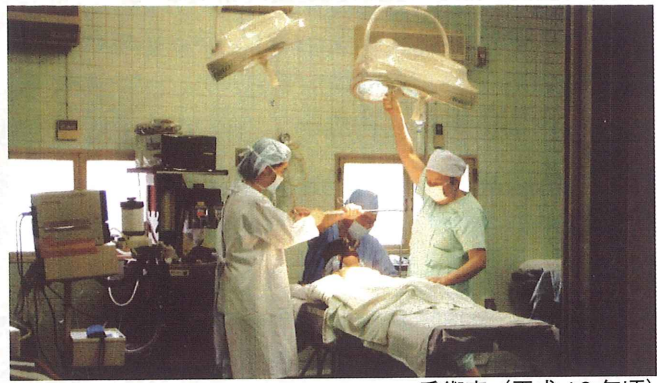
手術室（平成 10 年頃）