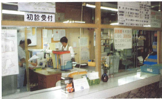
医事受付（平成 13 年頃）