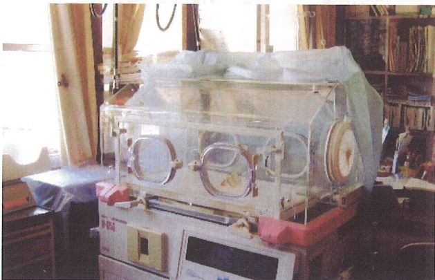
未熟児保育器（平成 5 年頃）