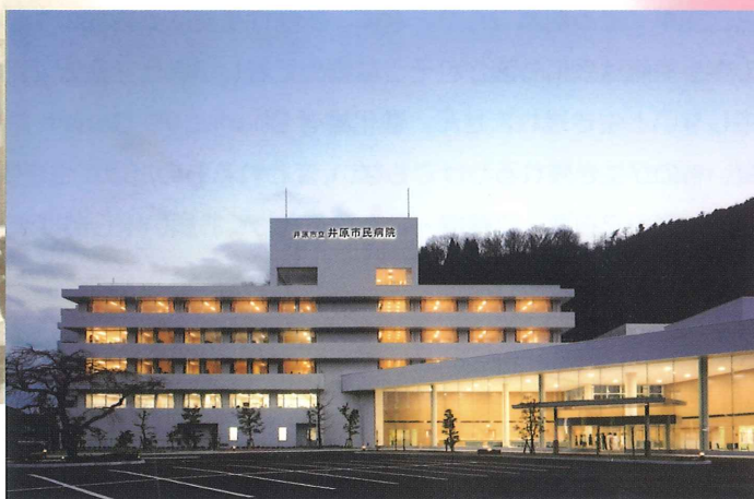
新病院施設 (平成16年2月完成)