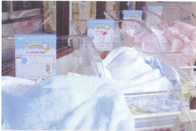
新生児室（平成 8 年頃）