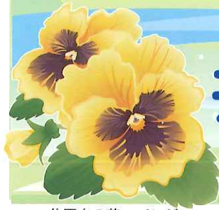
井原市の花 パンジー