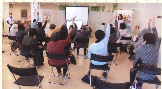
エコノミー症候群予防体操