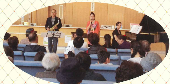
ロビーコンサート