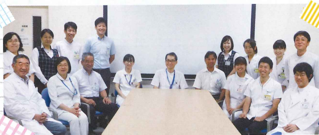
広報委員会 広報誌チーム一同

今回号より、広報委員会が新しいメンバーになりました。多職種の職員が集まって、当院の情報をより多くの方々に発信する使命を果たしたいと意気込んでおります。未熟なところもありますが、今後の「病院だより」にもご期待下さい!!