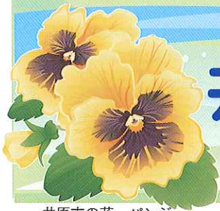
井原市の花 バンジー